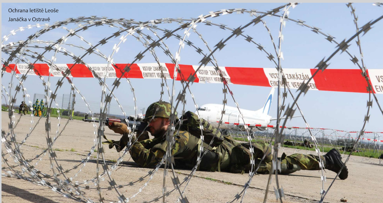
Ochrana letiště Leoše Janáčka v Ostravě

Jednotky AZ se postupně plní. Některé rychleji, protože jsou přirozeně atraktivní jako např. výsadkáři u 43. vpr, tanková rota,